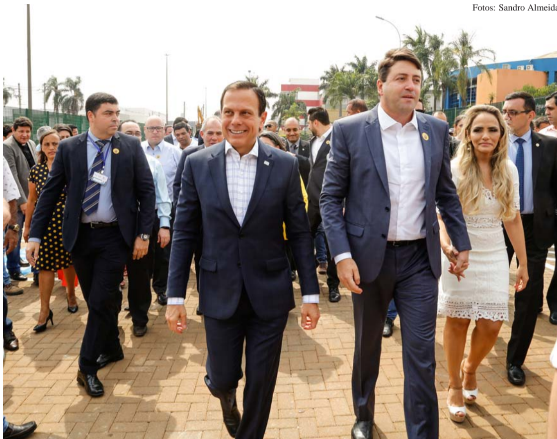
Governador João Dória e o Prefeito Elvis exibem a placa de inauguração do novo prédio da Fatec Santana de Parnaíba