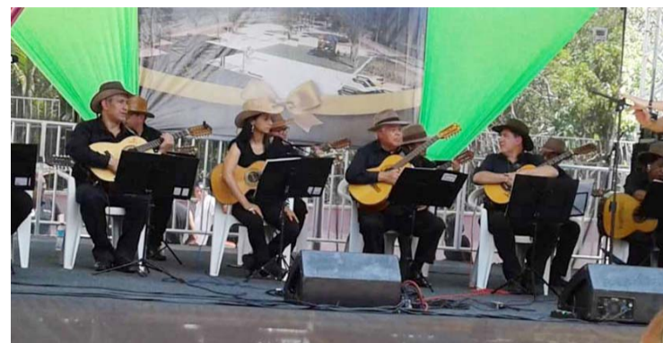
Orquestra de Viola Caipira da Secretaria de Cultura e Turismo

Guitarra, viola caipira e uma boa dose de humor. É o que tem na programação deste final de semana organizada pela Secretaria de Cultura e Turismo de Barueri.