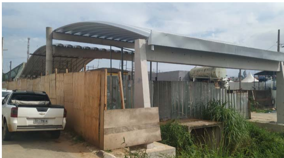
Construção da mini rodoviária em cima do córrego