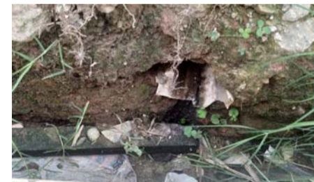
Tubulação que não atende os padrões