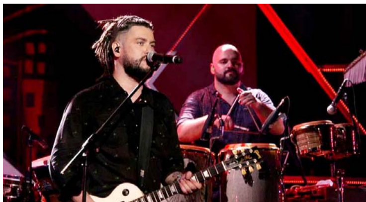
o Maneva já é uma das bandas mais ouvidas no aplicativo Spotify, superando 1,5 milhão de ouvintes por mês

No dia 21 haverá o Baile do Simonal, com Simoninha e Max de Castro, e em seguida, Dança de Salão. No dia 22 acontece o espetáculo Auto de Natal com a Cia. Carroça Teatral, seguido do coral Adulto do Núcleo de Música. No encerramento do Natal Encantado, no dia 24, será realizada uma queima de fogos às, 20h.