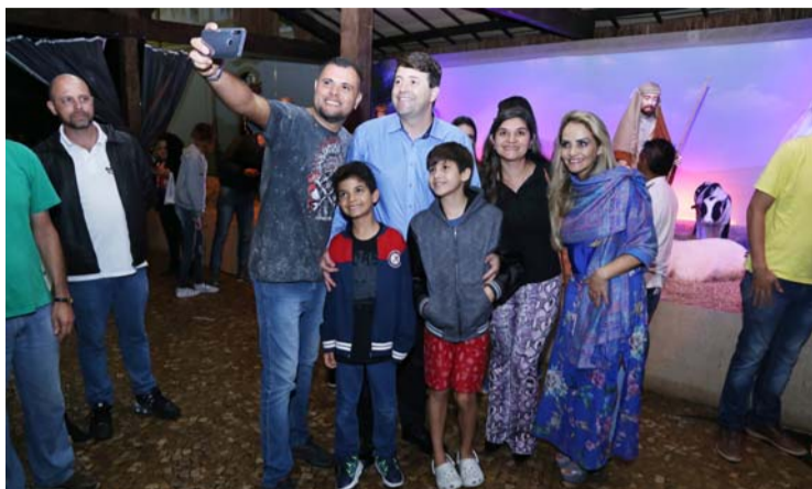
Moradores e turistas contemplam o novo presépio e a decoração natalina da Praça 14 de Novembro

Centenas de pessoas, entre autoridades, moradores e turistas compareceram na Praça 14 de Novembro para conferir de perto o presépio e a nova decoração natalina da cidade. Quando as 40 mil microlâmpadas foram ligadas e as cortinas do presépio foram abertas, os moradores olhavam encantados a decoração e os personagens articulados, que fazem