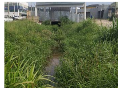
Construção da mini rodoviária em cima do córrego