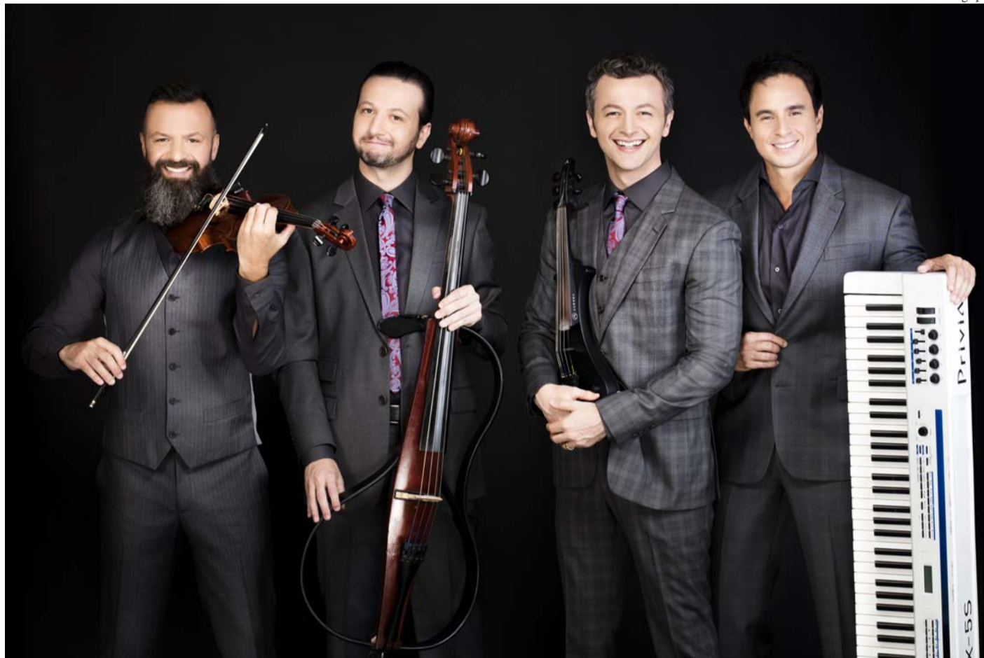
Show mostra novos arranjos para tradicionais canções de Natal

A programação do Natal Encantado de Barueri durante todo o mês apresenta os mais variados estilos musicais, envolvendo samba, rock, forró, sertanejo e clássico, além de dança, teatro, apresentações dos alunos e professores dos Núcleos de Dança e de Música, juntamente com alunos das Oficinas de Artes. Para encerrar as comemorações, no dia 24, haverá uma queima de fogos de artifícios, às 20h.