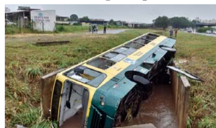
globoesporte gshow videos