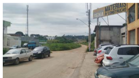
Rua Mario Scarvance 142, onde se localiza o Posto do Cartório Eleitoral;