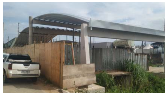
Basta olhar para ver as irregularidades