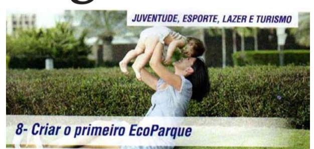
8- Criar o primeiro EcoParque

Garantindo atendimento a 100% da demanda.