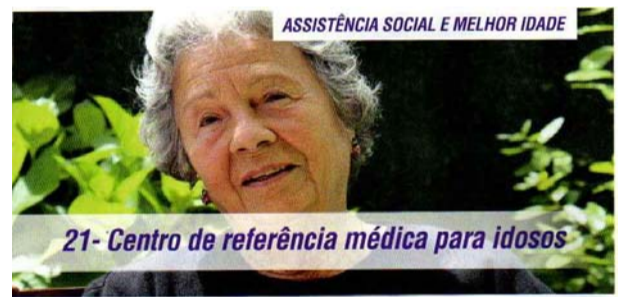
21- Centro de referência médica para idosos

Atendendo a demanda e facilitando o registro as ocorrências no município.