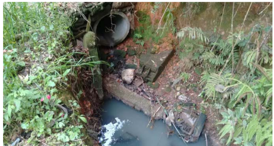
O bairro do Nagoya está abandonado, sujo e com córrego com manilhas destruídas que corre junto ao esgoto