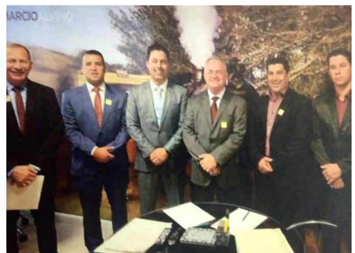
Os vereadores vão a passeio em Brasília, com pratinho na mão buscar recursos. Onde foram aplicados?