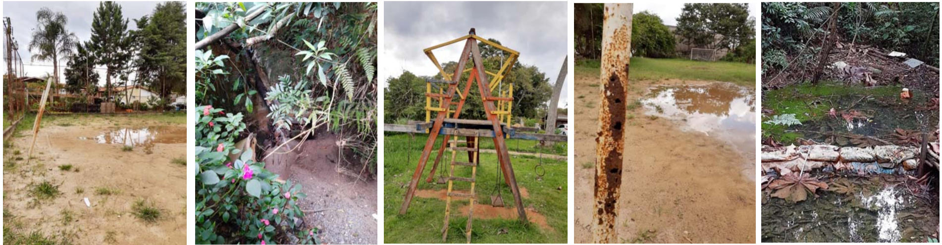
Nagoya: Um bairro bem cuidado, onde o mato tomou conta e o brinquedo para crianças uma verdadeira armadilha