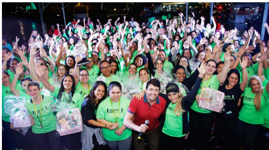
Prefeito e Primeira-dama posam para foto ao lado das vencedoras da 1ª Edição do Programa