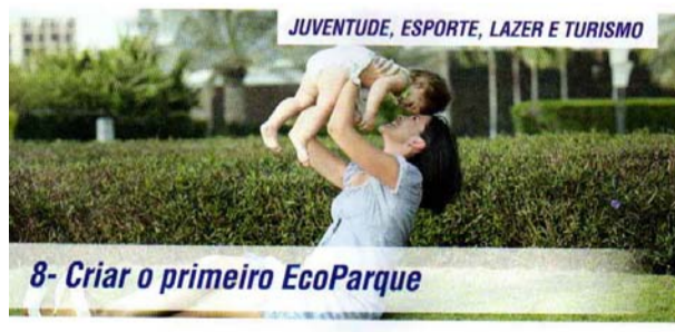
8- Criar o primeiro EcoParque

Prioridade na marcação de consultas e exames para idosos com a criação do centro de referência do idoso.