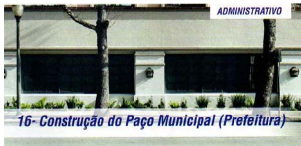
16- Construção do Paço Municipal (Prefeitura)

Foi bom mestre e soube ensinar ao aluno a arte de prometer e não cumprir.