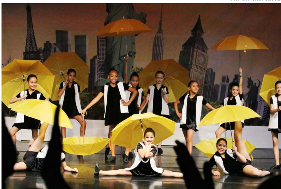
Apresentação do espetáculo de dança “Dias de Luz, Festa de Sol”

Neste ano o tema trabalhado pelos alunos para a produção dos espetáculos foi o aniversário de 60 anos da Bossa Nova, movimento da música popular brasileira que conquistou o Brasil e o mundo. Assim, todas as apresentações usaram algum elemento da Bossa Nova como inspiração para a montagem dos espetáculos.