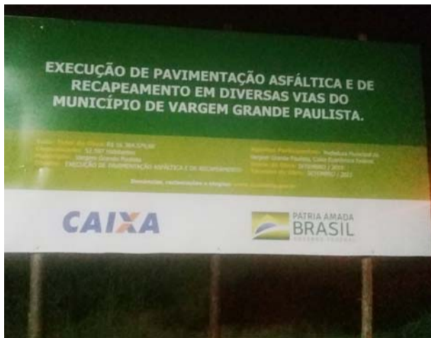
Placa colocada hoje (dia 18) próximo a rodoviária irregular que até ontem não constava placa nenhum. Sem fiscalização do CREA de Vargem Grande Paulista