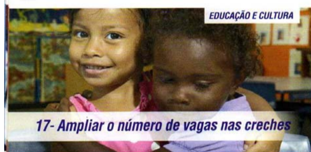
17- Ampliar o número de vagas nas creches

Garantindo atendimento a 100% da demanda.