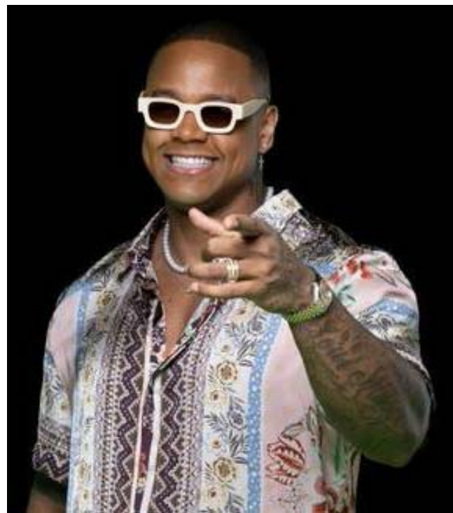
Léo Santana e sua banda se apresentam nesta quinta-feira, dia 20, às 20h

Abrindo a segunda semana de shows do Arraiá de Barueri, a Prefeitura, por meio da Secretaria de Cultura e Turismo (Secult), traz para a cidade o cantor Léo Santana. Ele e sua banda se apresentam nesta quinta-feira, dia 20, às 20h, no palco montado ao lado do Ginásio Poliesportivo José Corrêa.