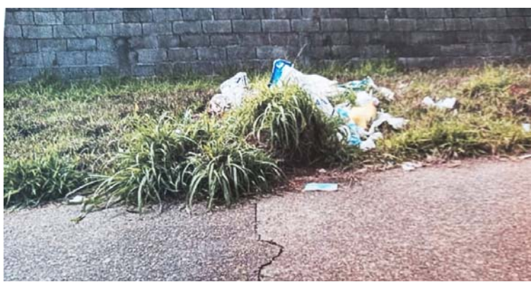
Assim é a cidade bem administrada, mato e lixo na rua e perto do PA do bairro Bela Vista. ( Posto de Saúde).