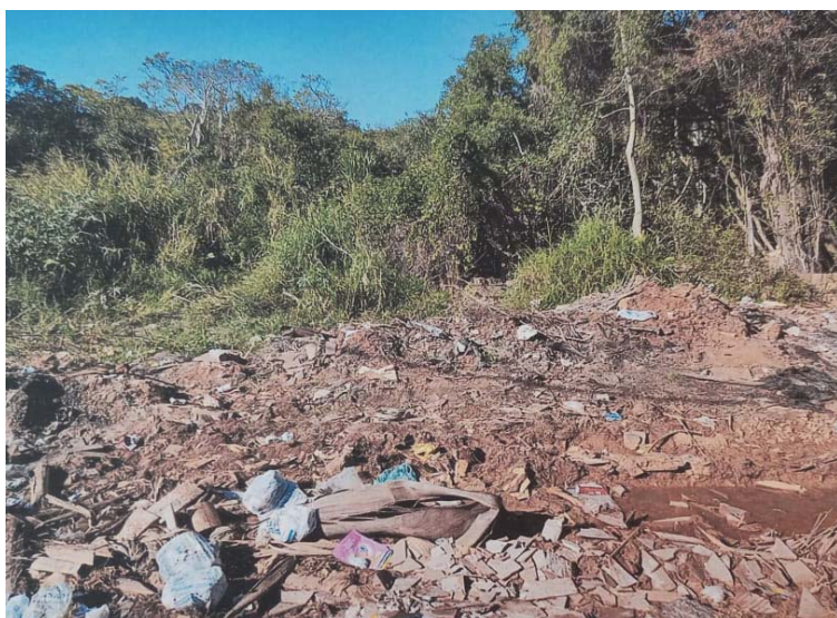
Pequena parte de um lado do lixão do centro da cidade. Perto da Rodoviária.