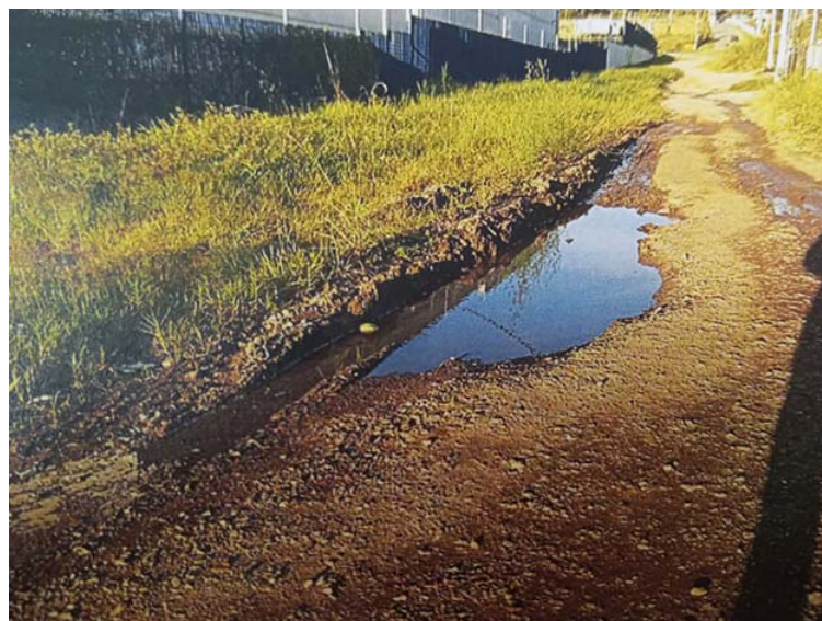
Rua do bairro Chácaras do Carmo, há 10 anos não recebe atenção municipal. É mato, lama e água parada, numa demonstração de descaso e falta de respeito com os moradores.