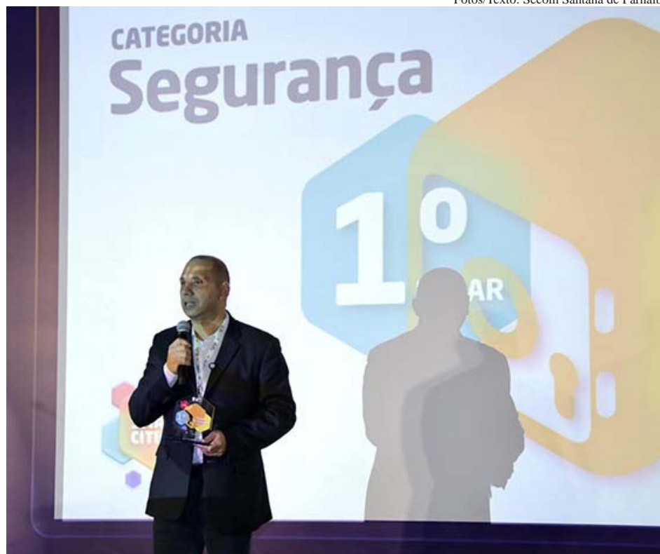
Além do primeiro lugar em Segurança, Santana de Parnaíba cresceu em outros importantes eixos