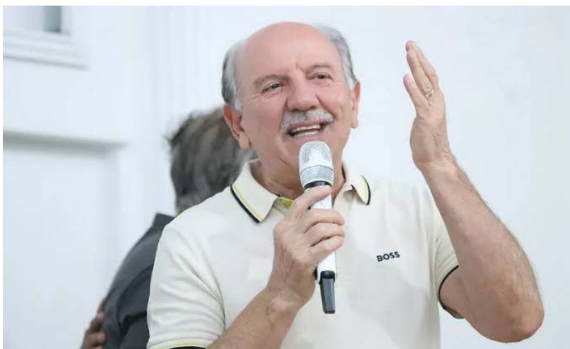
Prefeito Beto Piteri prepara maratona de inaugurações para o 76º aniversário de Barueri