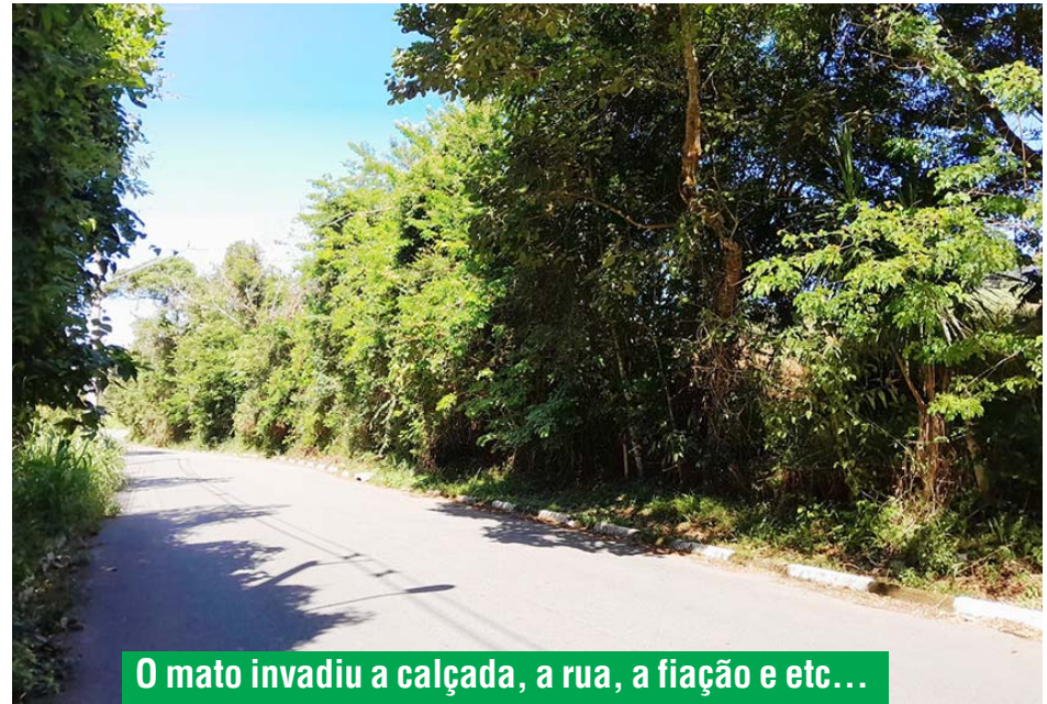
O mato invadiu a calçada, a rua, a fiação e etc...