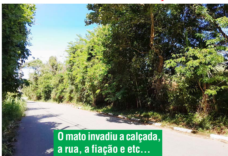
O mato invadiu a calçada, a rua, a fiação e etc...

Do centro aos bairros, é só o que vemos.