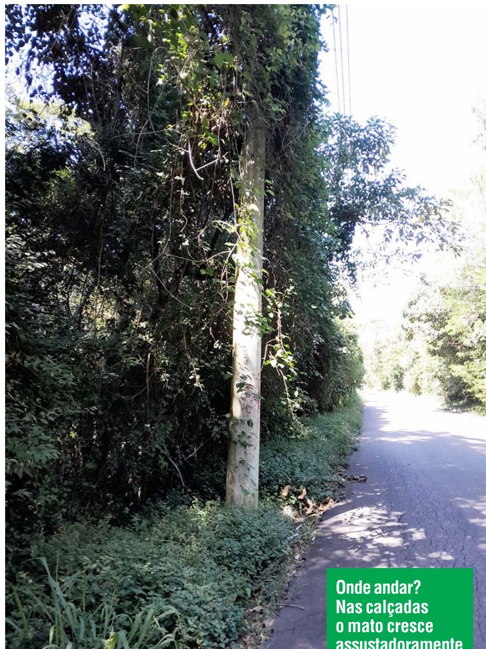
Onde andar? Nas calçadas o mato cresce assustadoramente