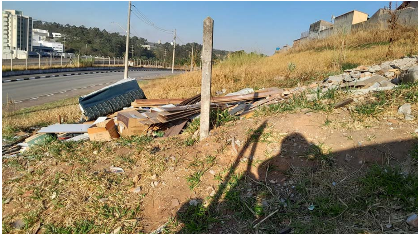
Terreno sem fechamento e com lixo descartado. Sem fiscalização no centro.

Parece absurdo ou alguém sem memória cometeu algo que não se imagina a alguém sem sentimento ou respeito possa deixar abandonado um animal que provavelmente lhe serviu por um tempo.