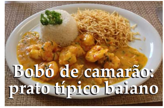
Bobó de camarão: prato típico baiano