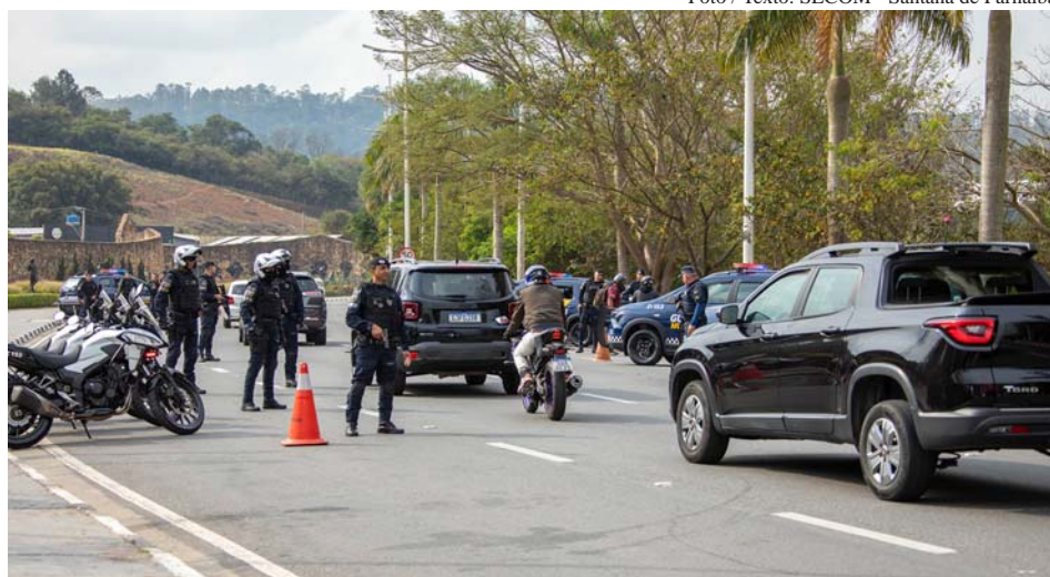
Cidade mais segura da Grande São Paulo amplia ações de segurança e investe em infraestrutura moderna para fortalecer a atuação da GCM

Em relação ao armamento e veículos, a GCM passou a contar com pistolas 9mm, carabinas CTT 40 e fuzis 5.56, além de 48 novos veículos, entre eles motocicletas Honda CBX 500, Jeeps Renegade, SUVs Trailblazer, caminhonetes S-10, Fiat Ducato e automóveis modelo Gol.