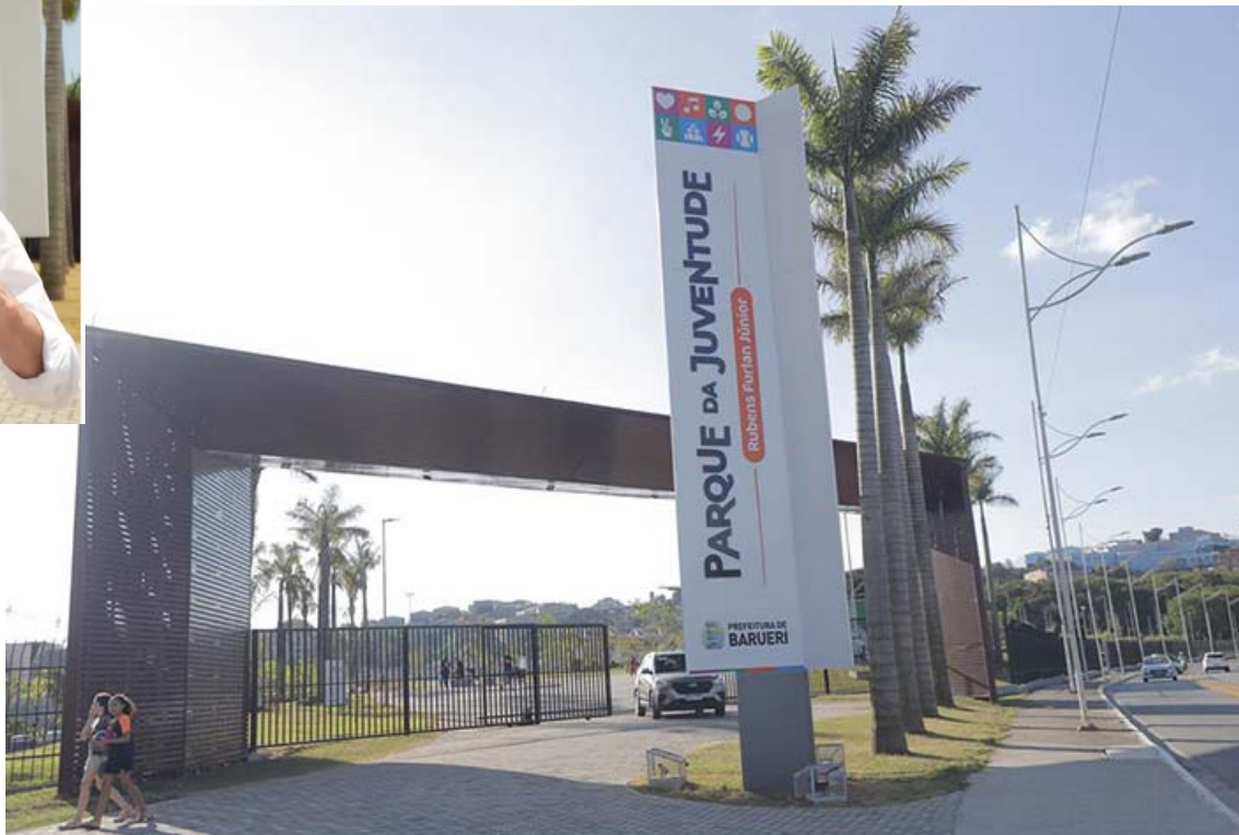
Inauguração do Parque da Juventude dia 19 terá atividades para toda a família