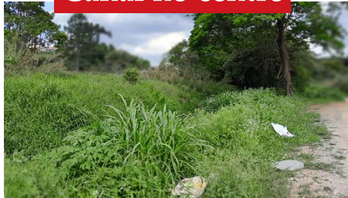
Assim está um dos córregos da cidade, esse no centro. Parece difícil sua limpeza, está assim há anos.