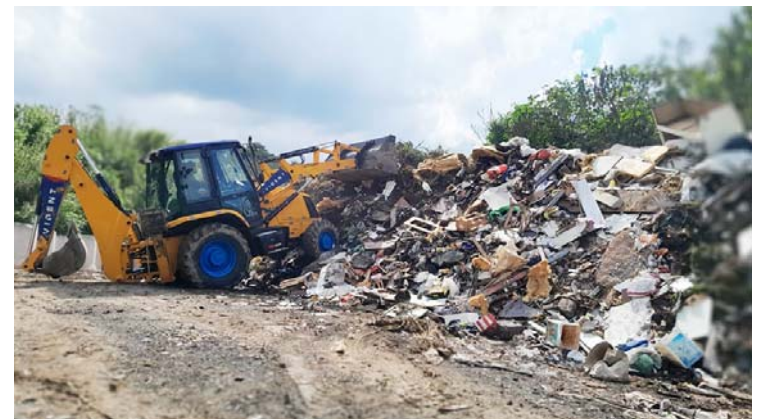
Máquina contratada para empurrar o lixo mais pro alto.