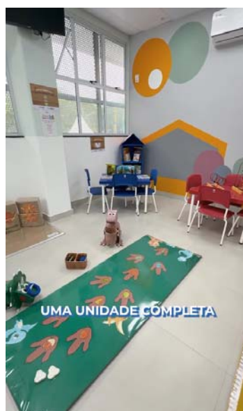
UMA UNIDADE COMPLETA

“Inauguramos a nova UBS Dra. Elisabete Izilda Duleba, no Chácara Marco. Uma unidade moderna, ampliada e preparada para oferecer um atendimento completo às famílias do bairro.