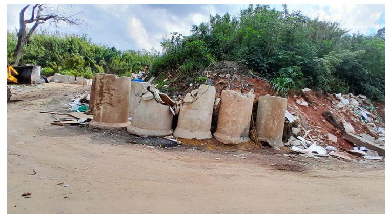
Depois dessa foto, esses tubos foram retirados (só os tubos), o lixo continua.