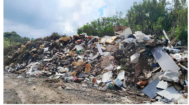
Lixão no centro