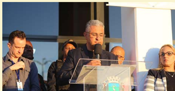
O Secretário de Segurança Pública Maruxo, quando do seu discurso junto as pessoas presentes no evento.