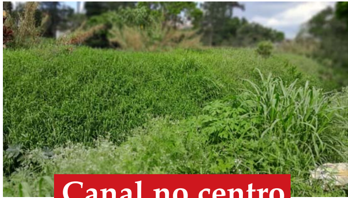
Canal no centro

PRA ONDE MUDARAM O POSTO DE ATENDIMENTO BIOMÉTRICO DO CARTÓRIO ELEITORAL DE VARGEM GRANDE PAULISTA, QUE FOI INAUGURADO EM PARCERIA COM O TRIBUNAL REGIONAL ELEITORAL-S.P. Que oferecia alguns serviços. Pra onde se mudou?