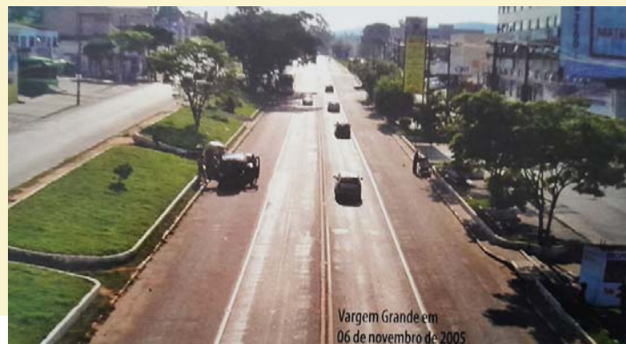
06 de novembro de 2005

Pela realidade que vemos....lamentavelmente....quantos?