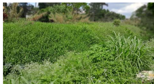
Vegetação em frente ao lixão do centro

Será que vão levar os turistas para visitar os "córregos" da cidade?