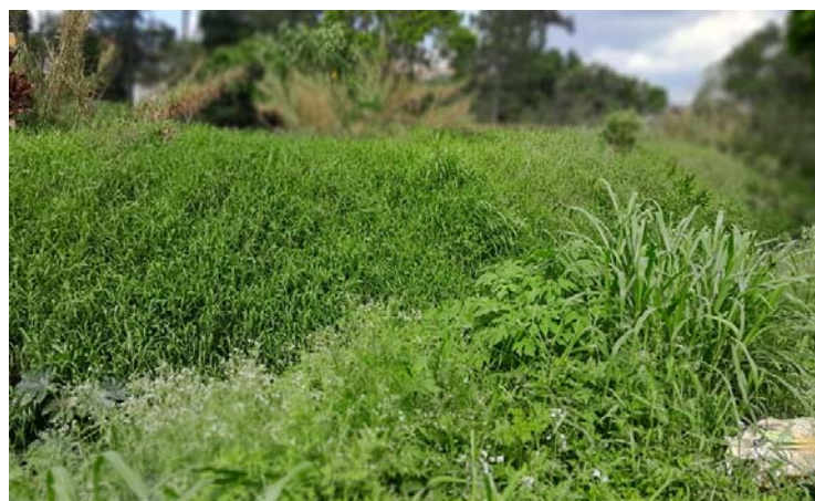
Vegetação em frente ao lixão do centro