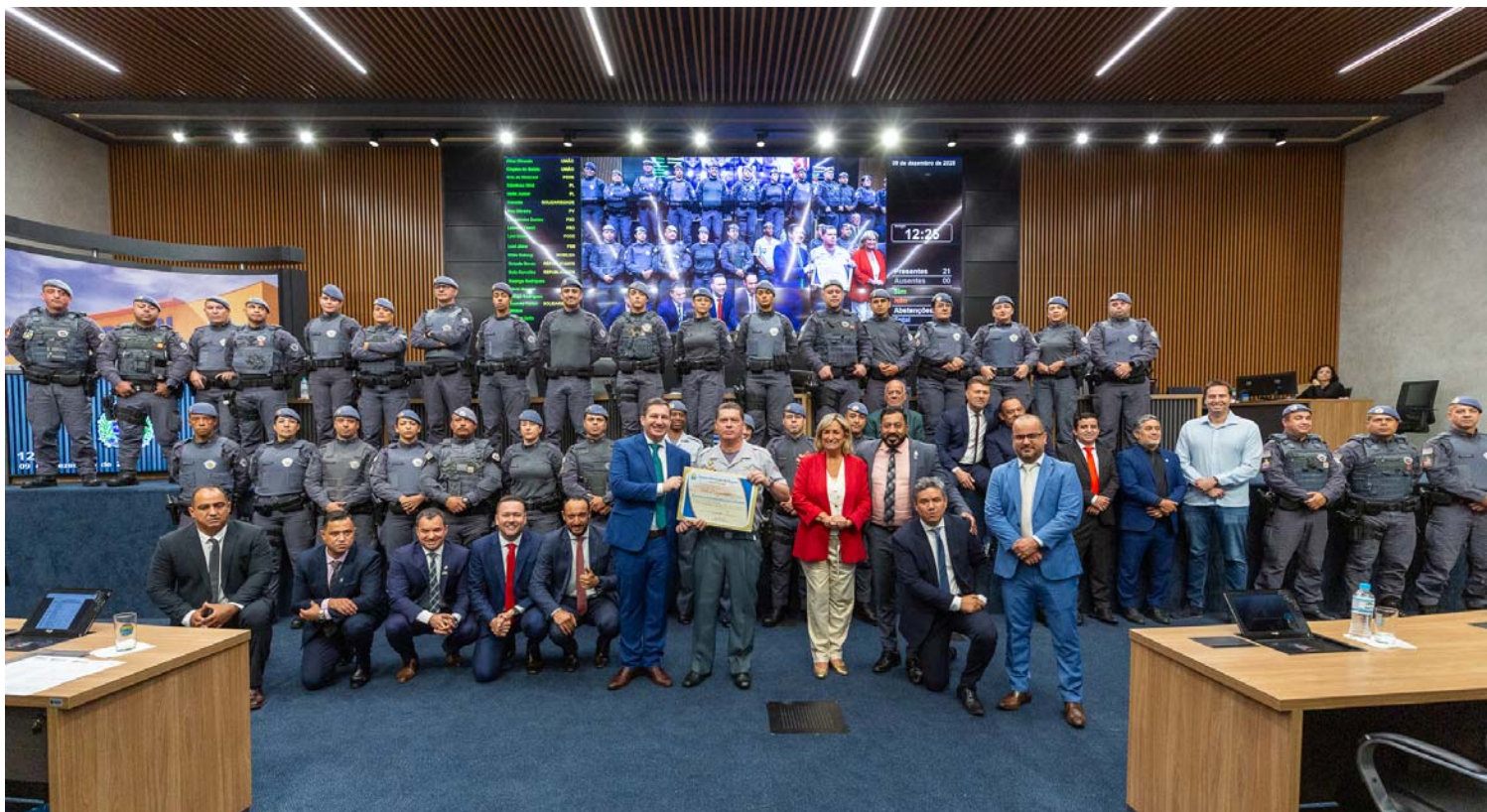
Homenagem dos vereadores em comemoração aos 40 anos da criação da unidade.

De acordo com o documento, a sede foi inaugurada em 29 de outubro de 1988, na rua Caim, no Jardim São Pedro. “Atualmente e provisoriamente, o batalhão se encontra na avenida Marginal Direita, no Jardim Paulista, até que a reconstrução da sede original esteja totalmente concluída”, informa a moção apresentada