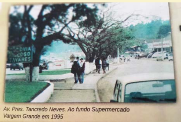
Av. Pres. Tancredo Neves. Ao fundo Supermercado Vargem Grande em 1995