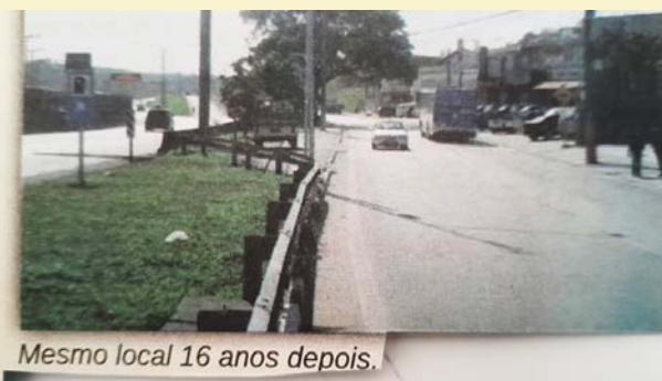
Mesmo local 16 anos depois.